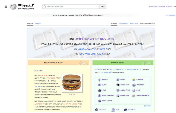
(a) Amharic article about the Big Mac burger.